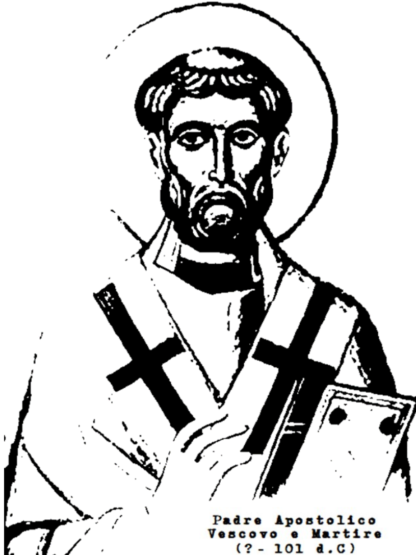
Padre Apostolico Vescovo e Martire (? - 101 d.C)